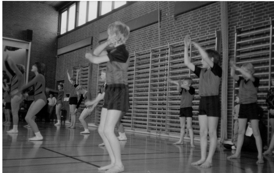
Pige- og drengehold 1987