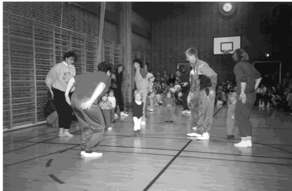
Mor, far og barn 1992