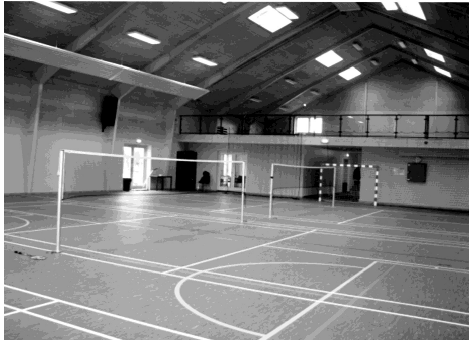
Klar til ibrugtagning