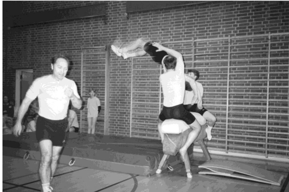
Far, bedstefar, knægt 1992