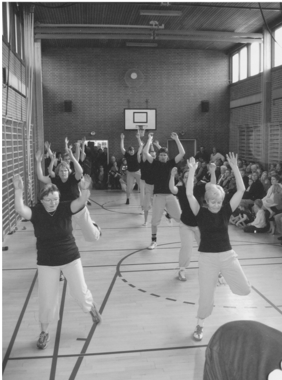
Mix-hold fra slutningen af 1990'erne