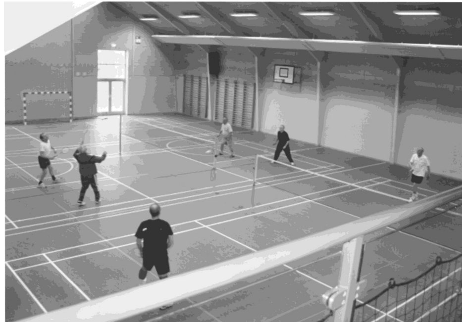
Badminton på flere baner i den nye multihal 2012