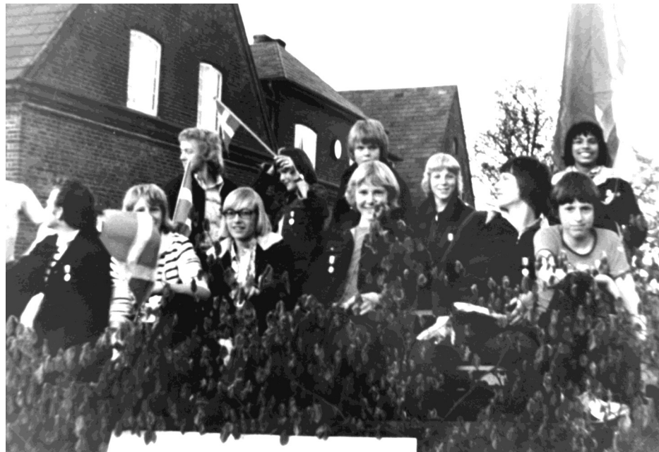
Danmarksmestrene i udsmykket vogn ved Hejls Skole