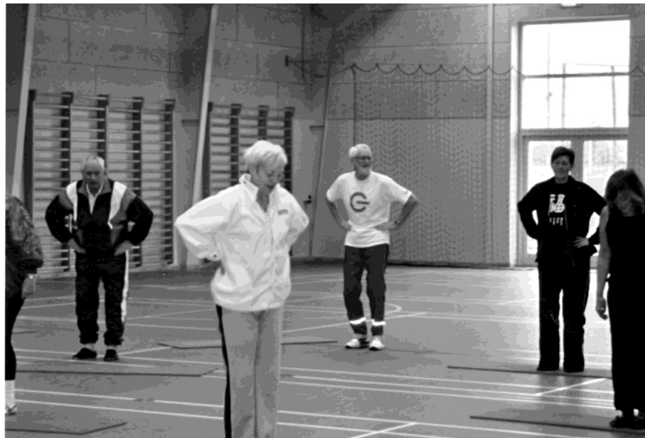
Idræt for alle