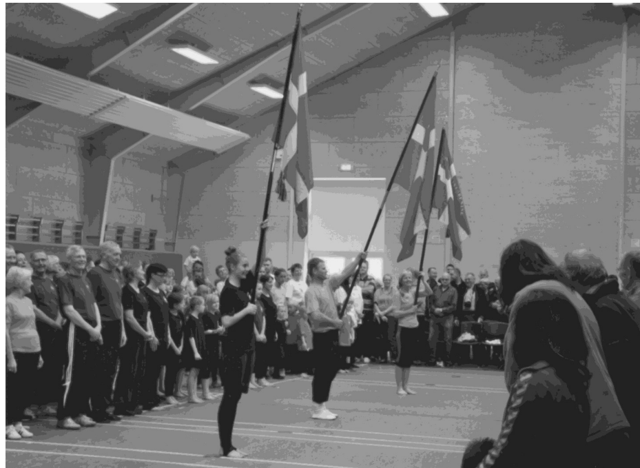
Opvisning i multihallen 2012