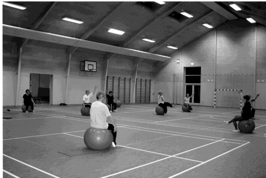
Krop og bevægelse