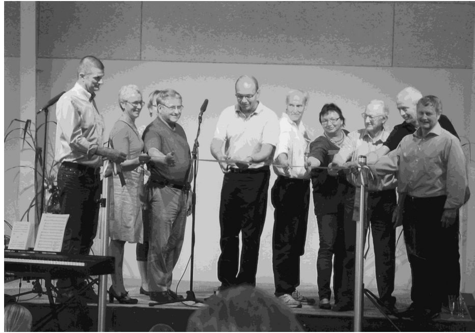
Fra indvielsen af Hejls Multihal 1. oktober 2012