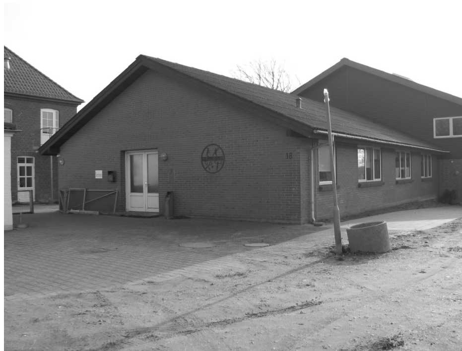
Hejls idrætsforenings klubhus