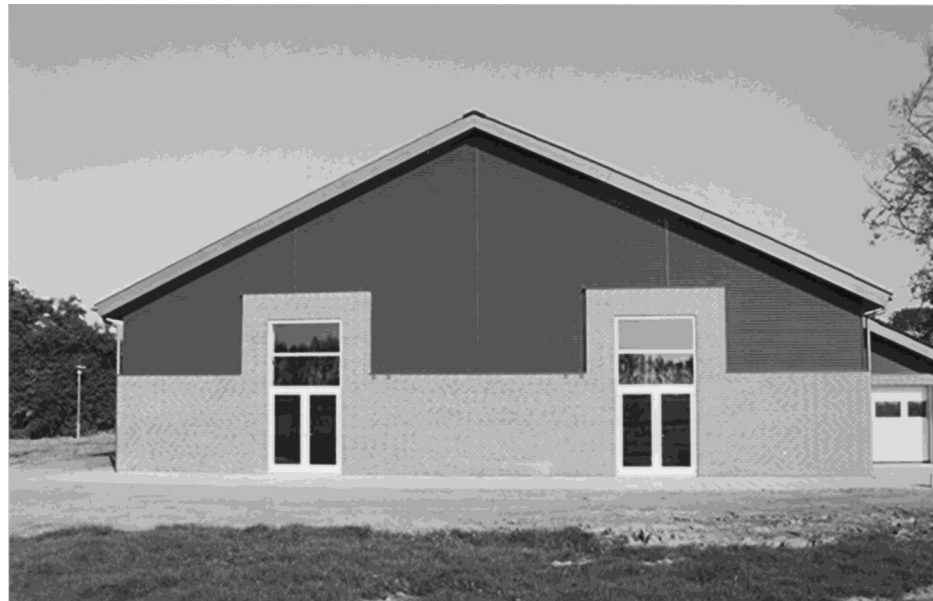
Multihallen set fra syd